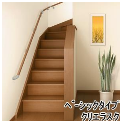
ペーシックタイプ クリエラスク