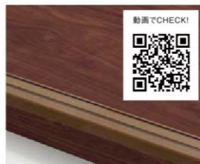
ベーシックタイプ

カド部を木質よりもやさしい樹脂素材で仕上げました。踏板より濃い色でラインを配置し、先端の視認性も確保しました。