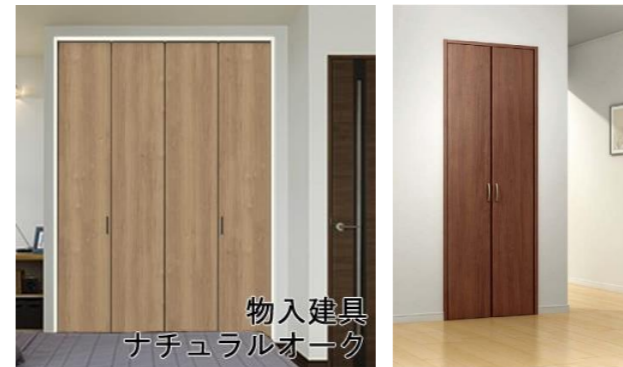
物入建具 ナチュラルオーク