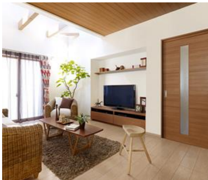
●例 建具：クリエラスク・床：クリエパール