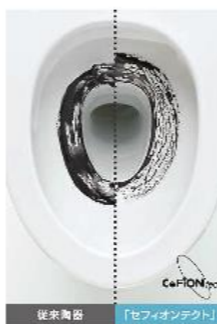
従来陶器 「セフィオンテクト」

陶器表面の凹凸を100万分の1mmのナノレベルでツルツルに。汚れが付きにくく、落ちやすいTOTO独自の技術です。