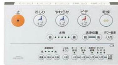
写真はGG3 / GG3-800