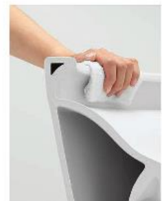
※イメージです。仕様により形状が異なります。

お掃除のしやすさを究めたTOTO独自のデザイン。奥までくっつき、フチがないから、サッとひとふき、お掃除ラクラクです。