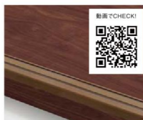
ベーシックタイプ

カド部を木質よりもやさらかな樹脂素材で仕上げました。踏板より濃い色でラインを配置し、先端の視認性も確保しました。