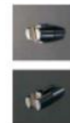
シャワーフック (メタル)