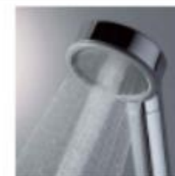
W水流シャワー (メタル)