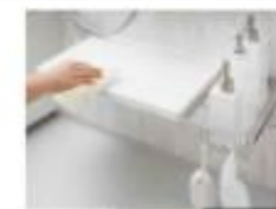
ホワイト ベージュ ブラック スゴピカカウンター (スクエア・ラック) (ホワイト)