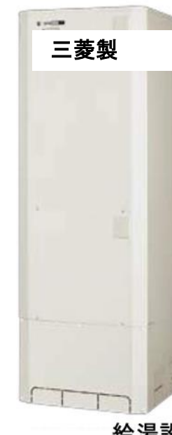
給湯設備 エコキュート